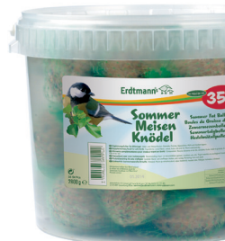
35 Sommermeisenknödel im Eimer

Erdtmann® Sommermeisenknödel sind für Wildvögel eine leichte und abwechslungsreiche Kost für die warmen Monate des Jahres. Besonders der leckere Mix aus verschiedenen Früchten sorgt an der Futterstelle für viel Vitalität.