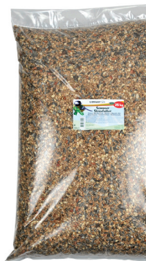
Sommerstreufutter 25 kg im Polybeutel

Erdtmann® Sommerstreufutter ist ein besonders vielfältiger Leckerbissen für alle Wildvögel. Die Zusammensetzung aus verschiedenen Getreidearten, feinen Sämereien, getrockneten Früchten und Speiseöl ist bestens auf die Bedürfnisse der Vögel in den Sommermonaten abgestimmt.